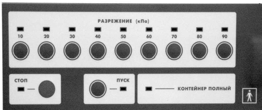
Рисунок 2 – Лицевая панель отсасывателя

Лицевая панель отсасывателя, приведена на рисунке 2.