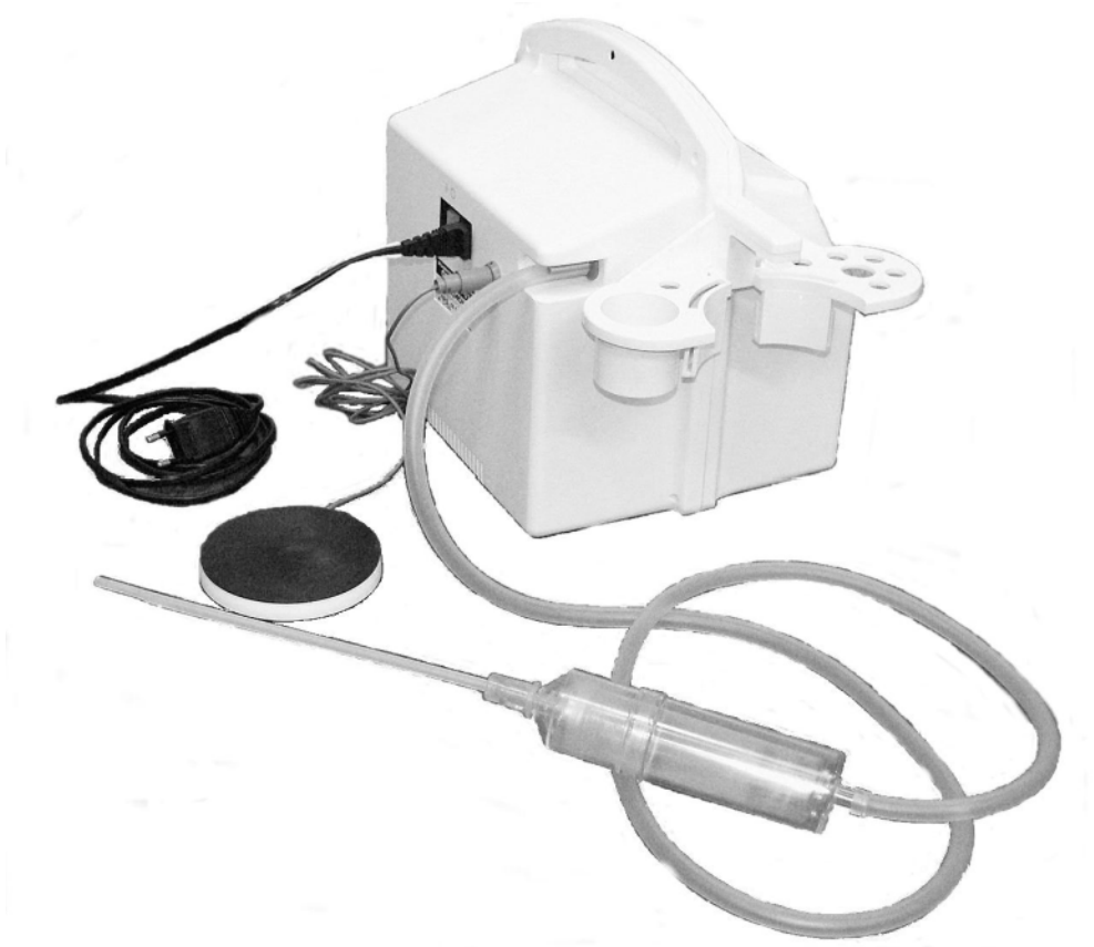
Рисунок 4 – Соединение трубок вакуумной магистрали при взятии аспирата

Соединение трубок вакуумной магистрали при взятии аспирата показано на рисунке 4.