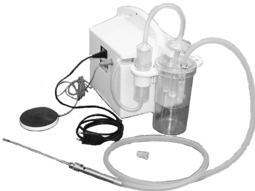
Рисунок 3 – Соединение трубок вакуумной магистрали при проведении операции

2.2.1 Подготовить отсасыватель к работе в соответствии с рисунком 3, для чего присоединить трубки вакуумной магистрали следующим образом: